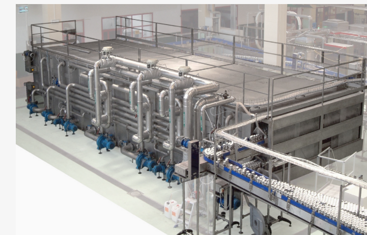
Double deck beer pasteurizing tunnel