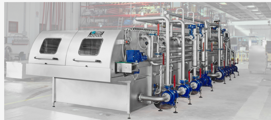
Single deck pasteurizing tunnel