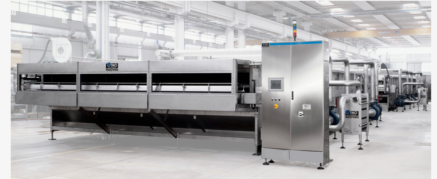
Twin cooling tunnels