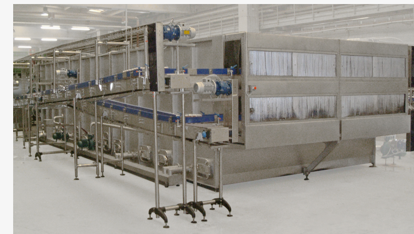
Double deck beer pasteurizing tunnel