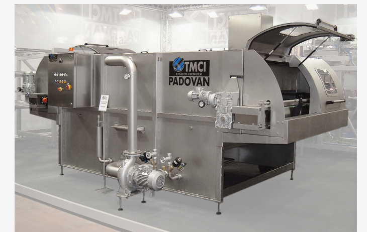
Monoblock warming tunnel