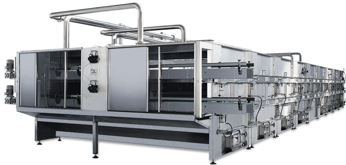
Double deck walking beam pasteurizing tunnel mod. Atlantico