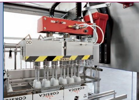
Testa multiformato Multiformat head Tête multiformat