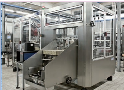
Magazzino cartoni Cases storage Magasin cartons