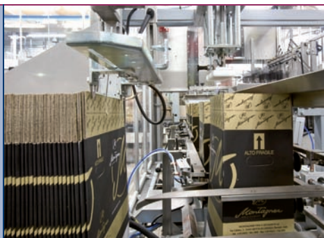
Stazione di formatura cartoni Cases opening station Section de ouverture cartons